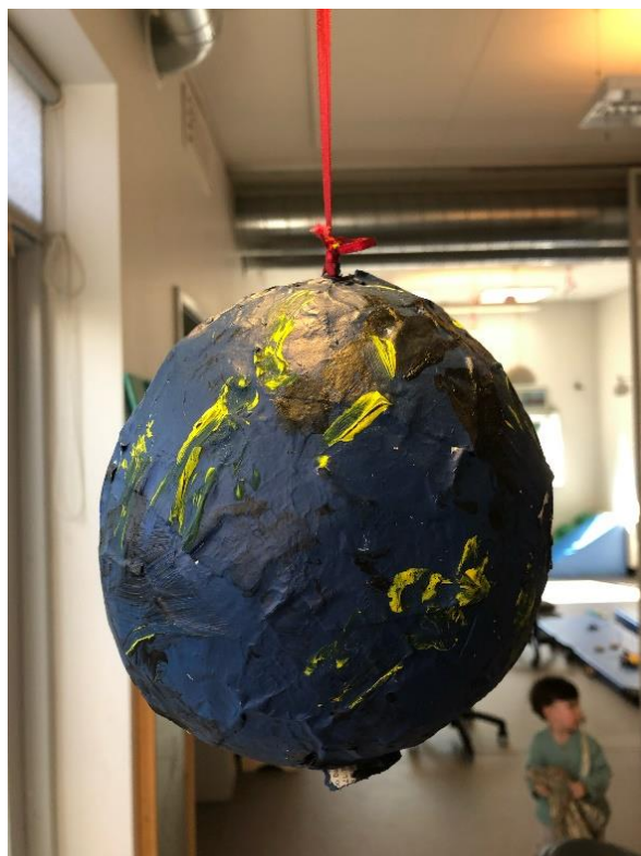
Her kan I se et af de kreative projekter der kom ud af bogen. Solen og Jorden.